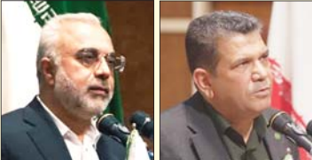
رئیس کل دادگستری فارس در جریان دیدار با اعضای هیئت مدیره کانون کارشناسان رسمی دادگستری استان فارس.