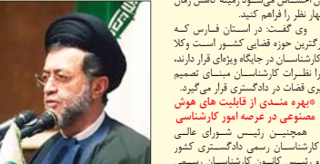
رئیس کانون کارشناسان رسمی دادگستری استان فارس در جریان دیدار با اعضای هیئت مدیره کانون کارشناسان رسمی دادگستری استان فارس.